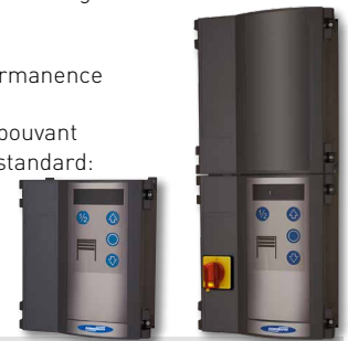
Disponible coffret de commande: